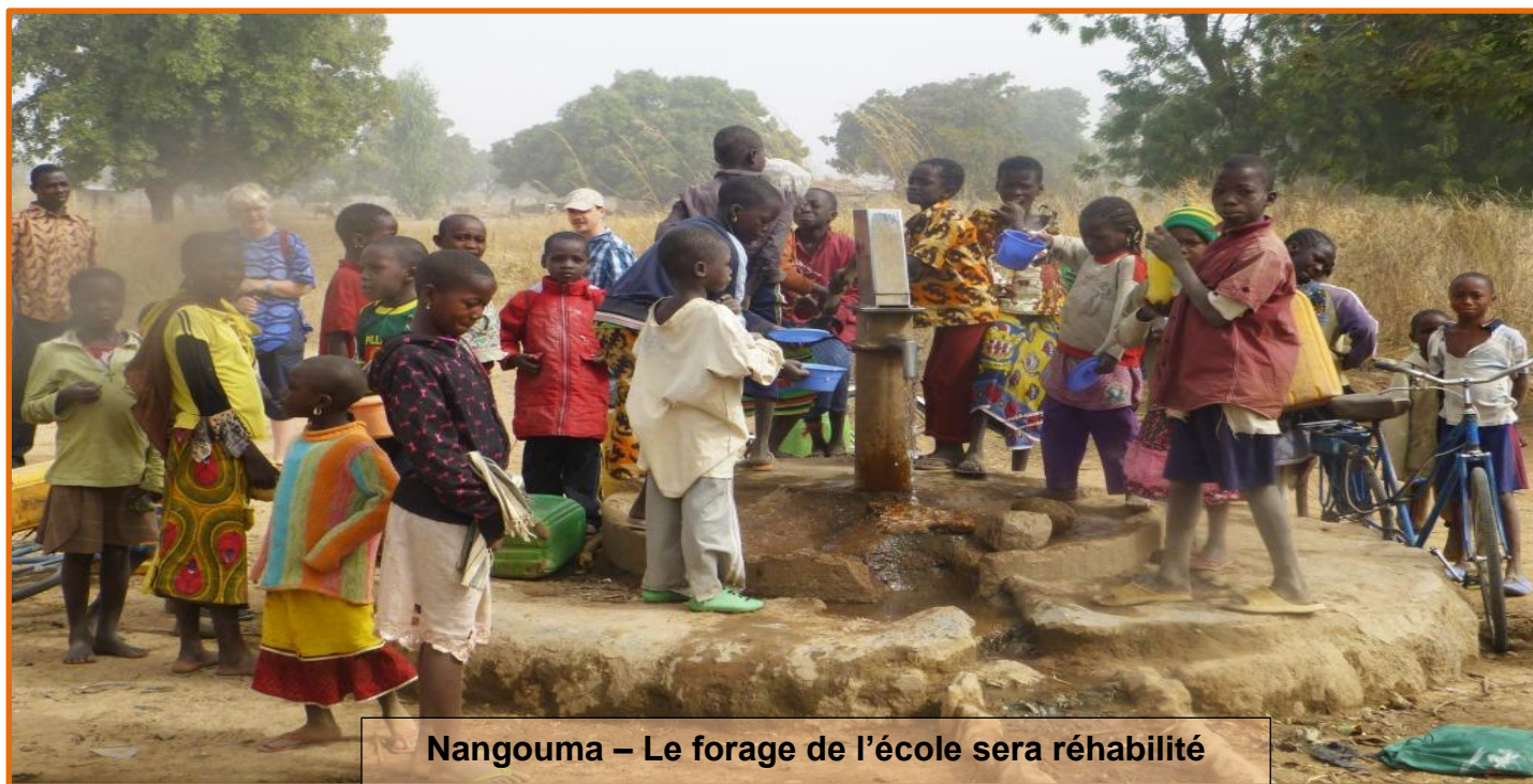
Nangouma – Le forage de l'école sera réhabilité